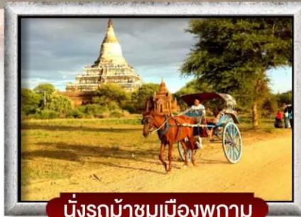
นั่งรถม้าชมเมืองพุกาม