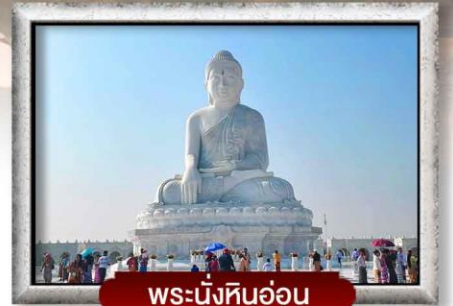
พระนั่งหินอ่อน