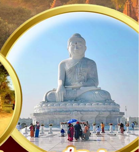
พระนั่งหินอ่อน