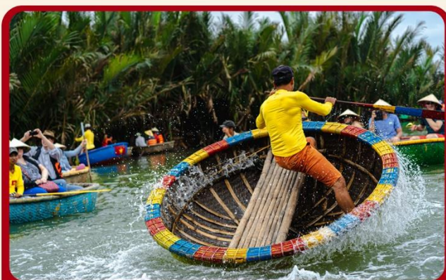
พิเศษ !!! นั่งเรือกระดัง UNSEEN เวียดนาม