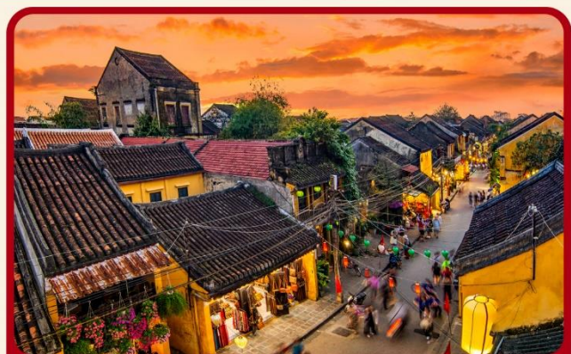
เที่ยวเมืองเก่าฮอยอัน