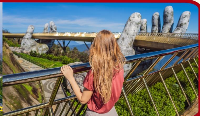
เที่ยวบานาฮิลล์เต็มวัน แบบจุใจ