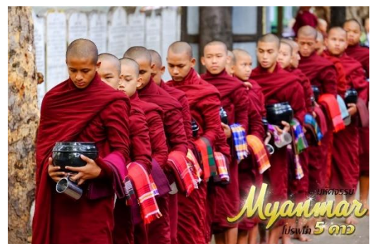
Myanmar 5 ดาว

จากนั้น เดินทางสู่ เมืองหงสาวดีหรือ เมืองพะโค ซึ่งในอดีตเป็นเมืองหลวงที่เก่าแก่ที่สุดของเมืองมอญโบราณที่ยิ่งใหญ่ และอายุมากกว่า400ปี ห่างจากเมืองย่างประมาณ80 กิโลเมตร) ใช้เวลาเดินทางประมาณ2 ชม.นำท่าน ตักบาตรพระสงฆ์กว่า 1,000 รูป ที่วัดใจ้คะวาย สถานที่ที่มีพระภิกษุและสามเณร ไปศึกษาพระไตรปิฎกเป็นจำนวนมาก ท่านสามารถนำสมุด ปากกา ดินสอไปบริจาคที่วัดแห่งนี้ได้