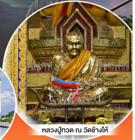
หลวงปู่ทวด ณ วัดช้างไห้