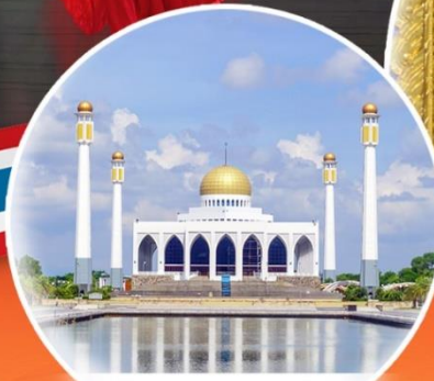
มัสยิดกลาง สงขลา