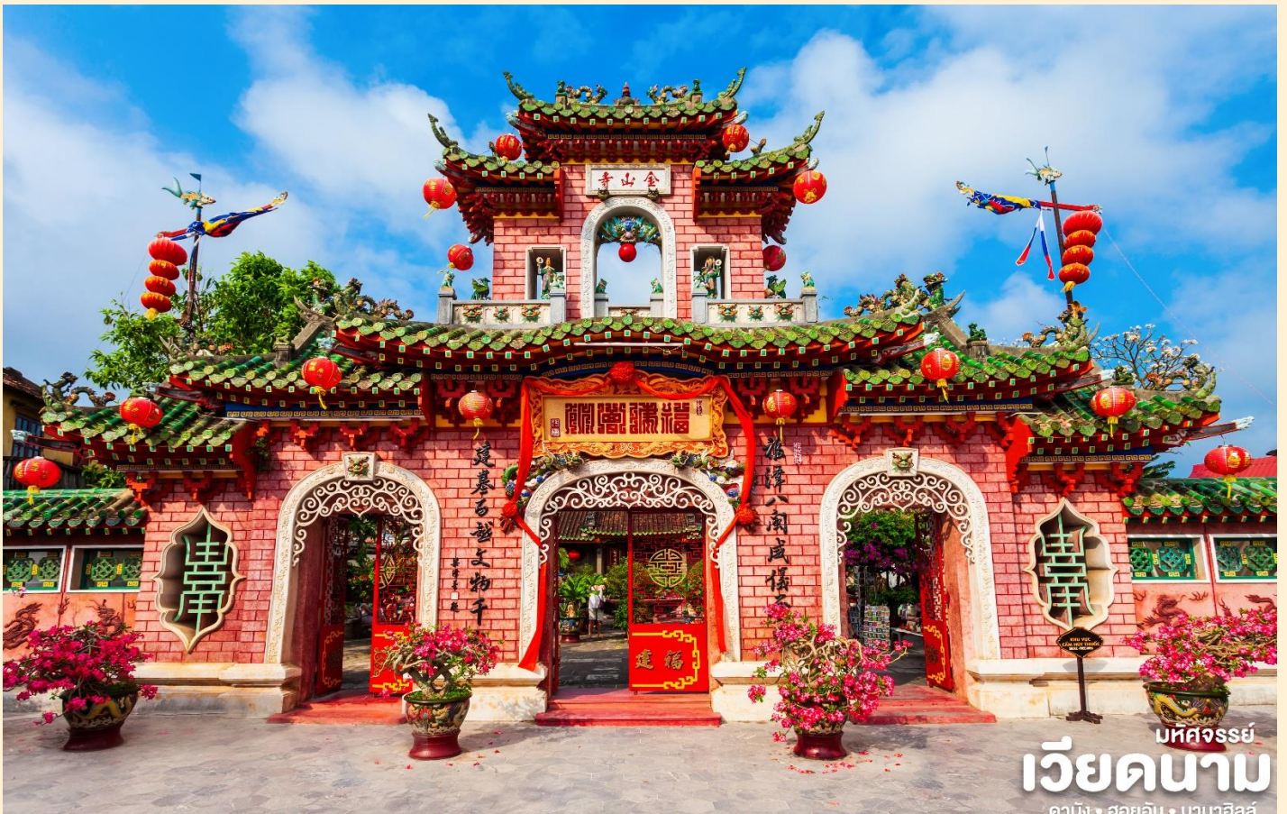
บหคจรรย เวียดนาม ดานัง • ฮอยอัน • บานาฮิลล์

นำท่านชม วัดจีน เป็นสมาคมชาวจีนที่ใหญ่และเก่าแก่ที่สุดของเมืองฮอยอันใช้เป็นที่พักปะของคนหลายรุ่น วัดนี้มีจุดเด่นอยู่ที่งานไม้แกะสลักลวดลายสวยงามท่าน สามารถทำบุญต่ออายุโดยพิธีสมัยโบราณ คือ การนำรูปที่ขุดเป็นก้นหอย มาจุดทิ้งไว้เพื่อ เป็นสิริมงคลแก่ท่าน