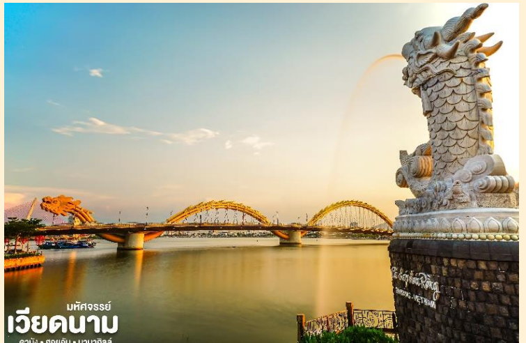
มหัสจรรย์ เวียดนาม ดานัง • ฮอยอัน • บันบานาฮิลล์

นำท่านชม สะพานมังกร Dragon Bridge อีกหนึ่งที่ยี่วดานังแห่งใหม่ สะพานมังกรไฟ สัญลักษณ์ ความสำเร็จแห่งใหม่ของเวียดนาม ที่มีความยาว 666 เมตร ความกว้างเท่าถนน 6 เลนส์ เชื่อมต่อสองฟากฝั่งของแม่น้ำฮันประเทศเวียดนาม สะพานมังกรถูกสร้างขึ้นเพื่อเป็น