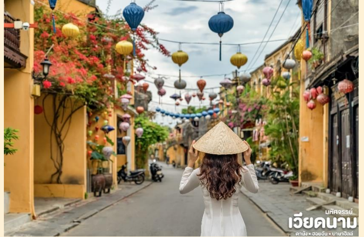
บหคจรรย เวียดนาม ดานัง • ฮอยอัน • บานาฮิลล์

เมืองฮอยอันนั้นอดีตเคยเป็นเมืองท่า การค้าที่สำคัญแห่งหนึ่งในเอเชียตะวันออกเฉียงใต้และเป็นศูนย์กลางของการ แลกเปลี่ยนวัฒนธรรมระหว่างตะวันตกกับตะวันออกองค์การยูเนสโกได้ประกาศให้ฮอยอันเป็นเมืองมรดกโลกทางวัฒนธรรมเนื่องจากเป็นสถานที่สำคัญทางประวัติศาสตร์ แม้ว่าจะผ่านการบูรณะขึ้นเรื่อยๆ แต่ก็ยังคงรูปแบบของเมืองฮอยอันไว้ได้