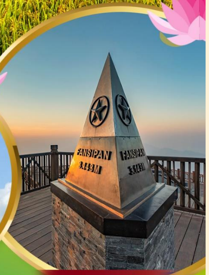
ฟานชิปัน