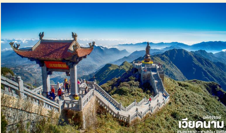
มหัสจรรย์ เวียดนาม ฮานอย • ซาปา • ฟานซิปัน • นิงห์บิงห์