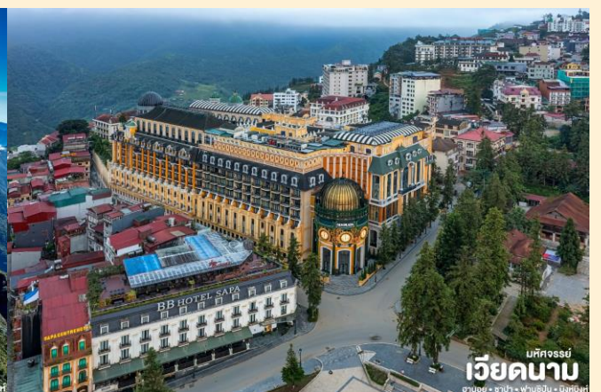
มหัสจรรย์ เวียดนาม ฮานอย • ซาปา • ฟานซิปัน • นิงห์บิงห์