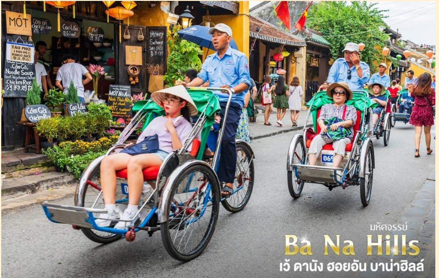
มหัศจรรย์ Ba Na Hills เว้ คานัง ฮอยอัน บาน่าฮิลล์

(ไม่รวมค่าทิปคนขี่สามล้อ ท่านละ 40 บาท/ต่อท่าน/ต่อทริป)