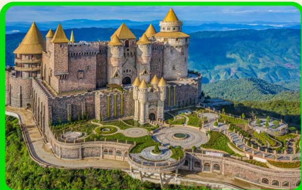
เที่ยวบานาฮิลล์แบบจุใจ เต็มวัน