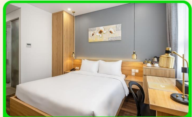
พักเมืองดานัง 4 ดาว 3 คืน