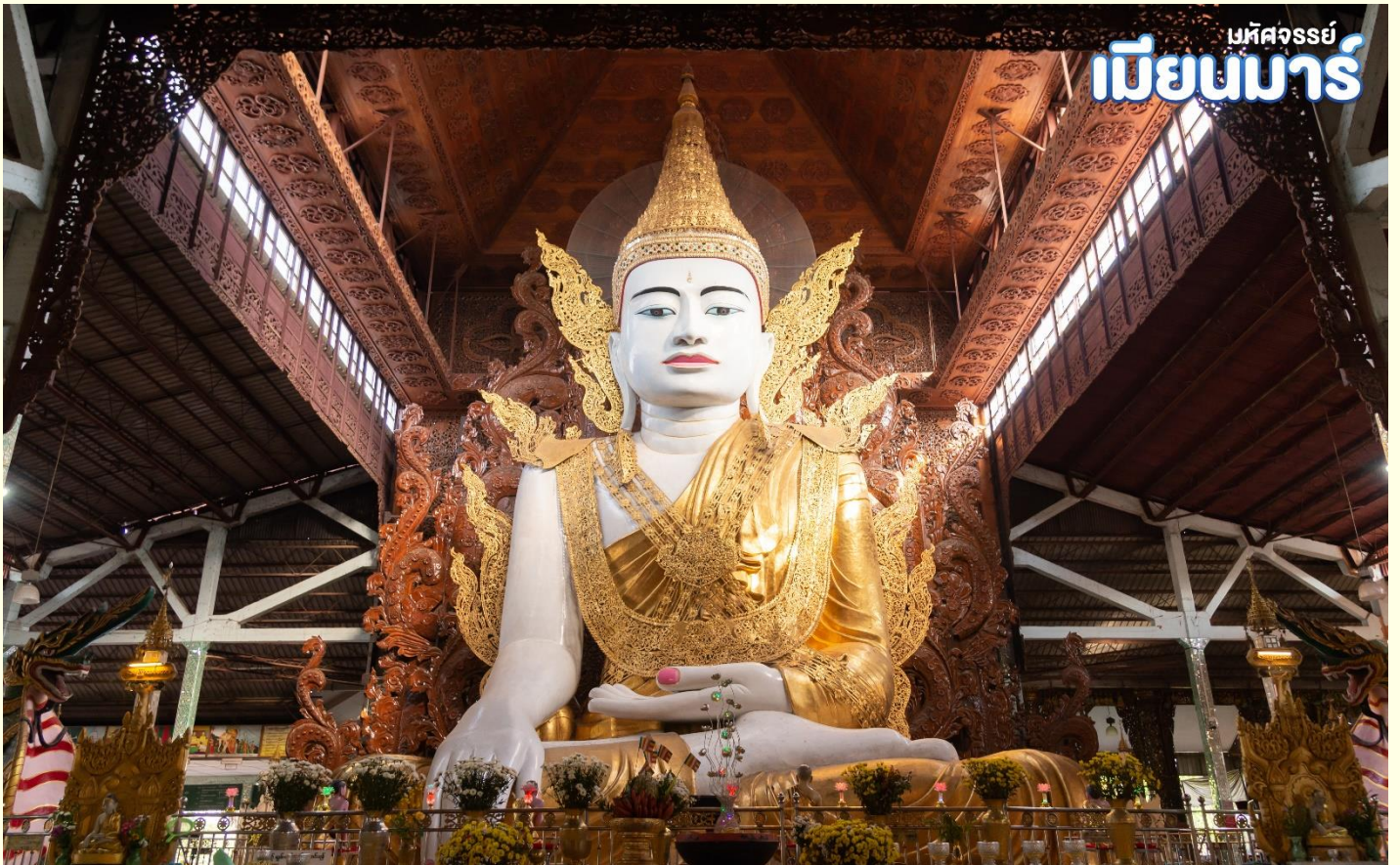
เมืงนมาร

สักการะ พระพุทธรูปองค์ใหญ่ หลวงพ่อกงาทัดจี (Nga Htat Gyi Pagoda) หลวงพ่อกงาทัดจีสูงเท่าตึก 5 ชั้น เป็นพระพุทธรูปปางมารวิชัยที่แกะสลักจากหินอ่อน ทรงเครื่องแบบกษัตริย์ เครื่องทรงเป็นโลหะ ส่วนเครื่องประกอบด้านหลังจะเป็นไม้สักแกะสลักทั้งหมด และสลักเป็นลวดลายต่างๆจำลองแบบมาจากพระพุทธรูปทรงเครื่องสมัยยะตะนะโงะ