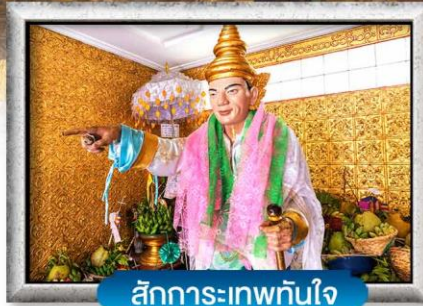
สัการะเทพกัใจ