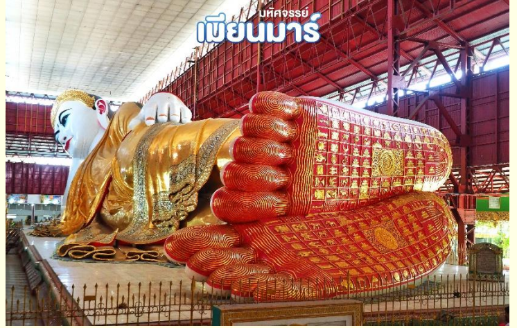
เมืงนมาร