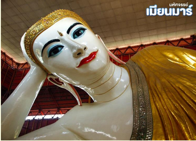
เมืงนมาร