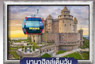
บาน่าฮิลล์เต็มวัน