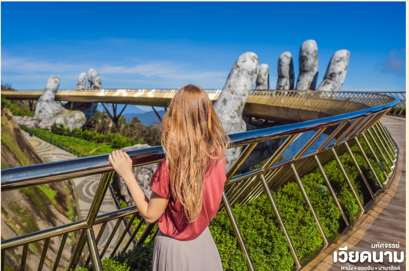
มหิศวรรษย์ เวียดนาม ดานัง • ฮอยอัน • บานาฮิลล์

กว่าจะเข้าพร้อมอากาศบริสุทธิ์อันสดชื่นจนทำให้ท่านอาจลืมไปเสียด้วยซ้ำว่าที่นี่ไม่ใช่ยุโรป เพราะอากาศที่หนาวเย็นเฉลี่ยตลอดทั้งปีประมาณ 10 องศาเท่านั้นจุดที่สูงที่สุดของบานาฮิลล์มีความสูง 1,467 เมตรกับสภาพผืนป่าที่อุดมสมบูรณ์ นำท่านชม สะพานสีทอง สถานที่ท่องเที่ยวใหม่ล่าสุดตั้งโดดเด่นเป็นเอกลักษณ์อย่างสวยงาม บนเขาบานาฮิลล์