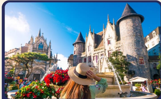
เที่ยวบานาฮิลล์แบบจุใจ เต็มวัน