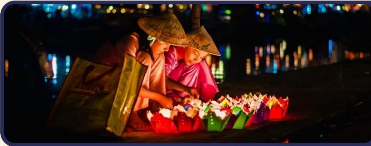
ล่องเรือลอยกระทงที่ฮอยอัน