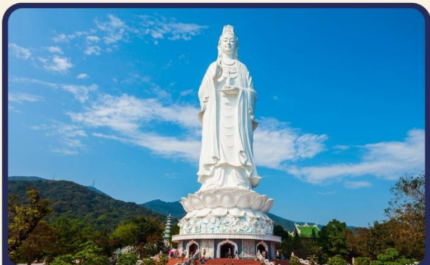
วัดลินห์ฮั่ง (Linh Ung) วัดที่ใหญ่ที่สุดของเมืองดานัง