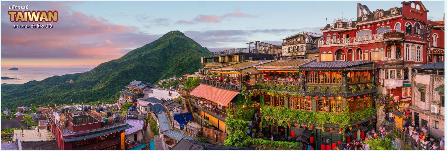
บทควรรษ์ TAIWAN บทนครแห่งเมืองสี่สิบ

จากนั้น นำท่านเข้าพักที่ เมืองเกาหยวน หรือเทียบเท่าตามมาตรฐานได้วัน