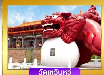
วัดเหวินหัว