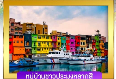
หมู่บ้านชาวประมงหลากสี