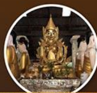
พระพุทธรูปบานอองหมื่นสงจ่าฮีน

2 วัน 1 คืน บินเช้า-กลับดึก 6,900.- เริ่มที่