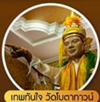
เทพทันใจ วัดโบดาทาวน์