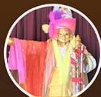
เทพทันใจ โจ๊ะซ่า