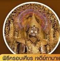
พิธีครอบเศียร เจดีย์กาบาอ