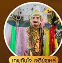
เทพทันใจ เจดีย์ชเวด