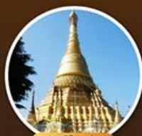
เจดีย์จิกะसान