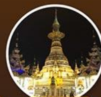
เจดีย์อ่องดอหย่า