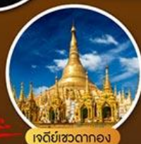
เจดีย์ชเวดากอง