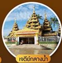
เจดีย์กลางน้ำ

2 วัน 1 คืน บินเช้า-กลับดึก 6,900.- เริ่มที่